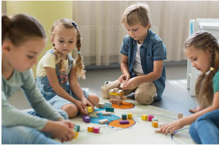
Learning through play (freepik.com)

‘The impact has been profound’: the headteacher bringing play back to the classroom