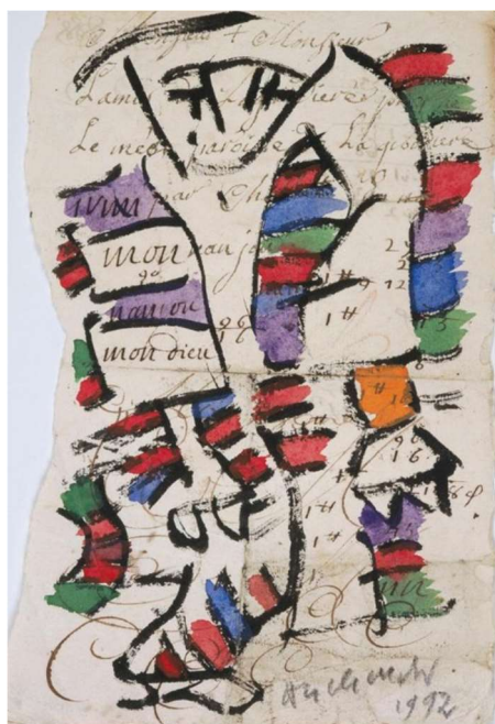
Pierre Alechinsky (1927 -), Sorti de la poche , 1992, encre de Chine et aquarelle sur vergé du XVII e siècle (pièce avec écritures et essais de plume), 19,5 x 13 cm, Paris, centre Georges Pompidou.