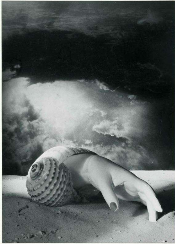
Dora Maar, Sans titre [Main-coquillage], négatif gélatino-argentique sur support souple, 23,4 x 17,5 cm, vers 1934, Centre Pompidou, Paris.

Document n°1 : Ressources iconographiques susceptibles d'être mobilisées dans la conception et/ou le déroulé de la séance.