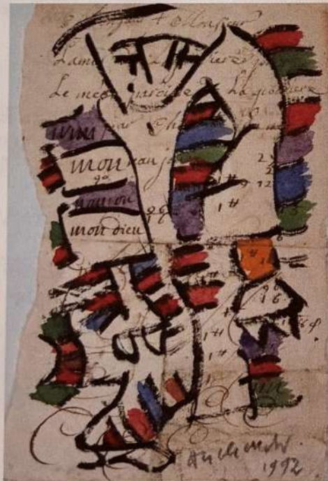
Pierre Alechinsky (1927 -), Sorti de la poche , 1992, encre de Chine et aquarelle sur vergé du XVII e siècle (pièce avec écritures et essais de plume), 19,5 x 13 cm, Paris, centre Georges Pompidou.