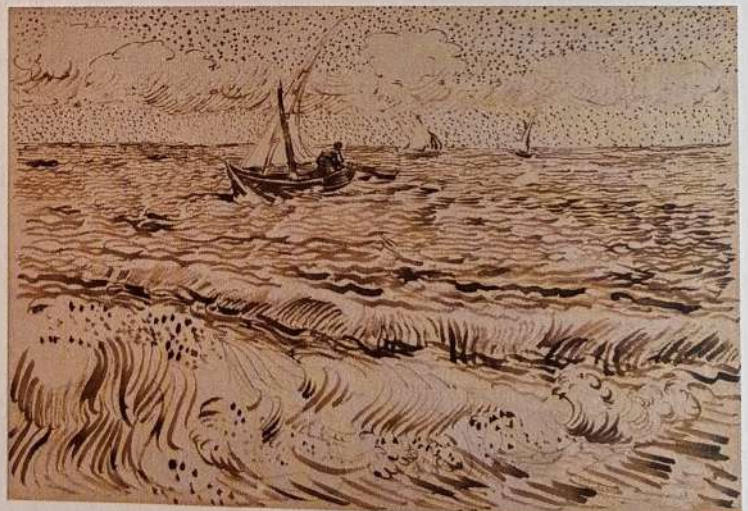
Vincent Van Gogh (1853-1890), Bateaux de pêche aux Saintes-Maries-de-la-Mer , 1888, encre et crayon sur papier, 24,4 x 31,9 cm, Saint Louis Art Museum, États-Unis.