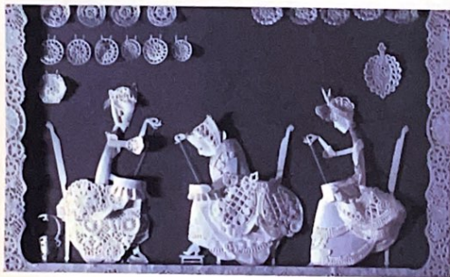
Michel Ocelot, Les Trois inventeurs , 1979, photogramme, film d'animation, papier découpé, 13 minutes, France.