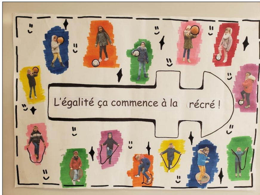
Lauréat 2022-2023 : Ecole primaire Pasteur – Frelinghien – CP-CE1