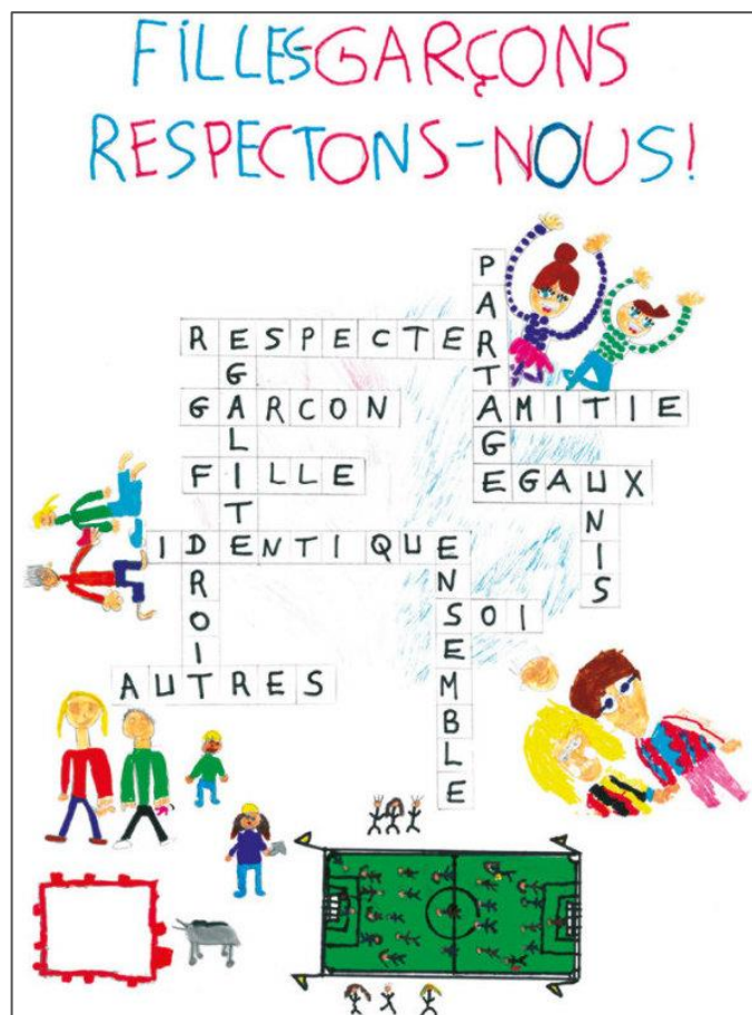
Lauréat 2019-2020 : Ecole élémentaire Meunerie - Dunkerque